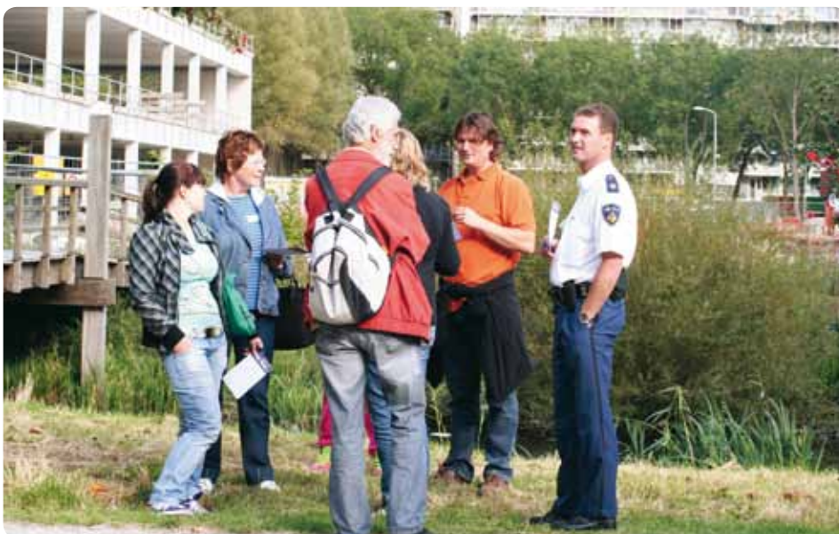
'Palenstein komt buiten!'

In september en oktober 2009 zijn hiervoor onder begeleiding van PJ PARTNERS vijf place games© gehouden. In een place game© gaan buurtbewoners in groepen naar buiten, om plekken te beoordelen en ideeën te bedenken voor verbeteringen van de inrichting. Er deden 75 bewoners mee, jong en oud. De place games© leverden veel goede ideeën op. Een kleine enthousiaste groep bewoners is doorgegaan en heeft zich gebogen over alle ideeën en de tekeningen die zijn gemaakt. Er moesten keuzes gemaakt worden. En dat is gelukt. De gemeente heeft de tekeningen omgezet in een ontwerp, waarin op verzoek van de bewoners onder meer een skateplaza, een waterspeelplek en een honden-uitlaatstrook zijn opgenomen.