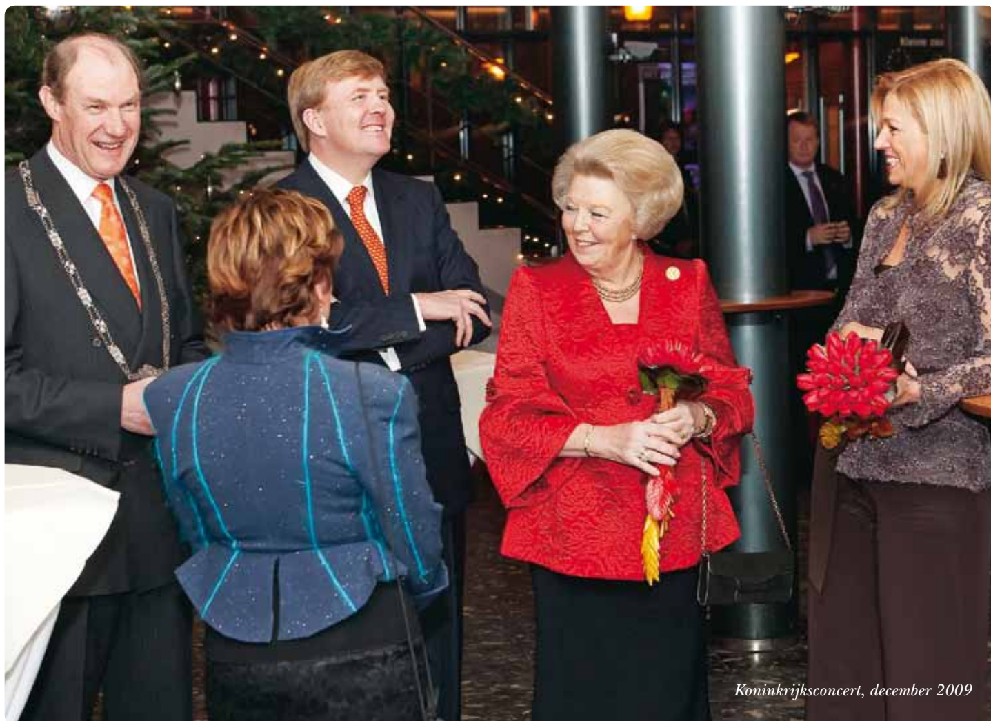
Koninkrijksconcert, december 2009

A ls stadsbestuur ben je vaak bezig met het oplossen van problemen. Dan vergeet je wel eens oog te hebben voor de wijk- en buurtbarbecue, het zwerfvuil, de sponsorloop of het buurtfeest, kortom voor wat er goed gaat in de stad. En dat is veel! Het bezoek van koningin Beatrix, prins Willem-Alexander en prinses Máxima aan het Koninkrijksconcert was natuurlijk een hoogtepunt, maar ook de sportevenementen, de wijk- en buurtbarbecue, het thrillerfestival en de ondernemersbijeenkomsten. Daarnaast is in de wijken veel georganiseerd. Het is mooi om te zien dat mensen iets doen