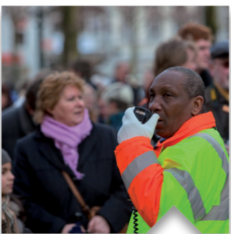
Iedereen doet mee. Als we investeren in werk voor mensen, kan iedereen bijdragen aan een sterk en gelukkig Nederland.

GroenLinks investeert in de toekomst. Goede investeringen verdienen zichzelf terug. Talloze plannen van GroenLinks bewijzen dat in de praktijk.