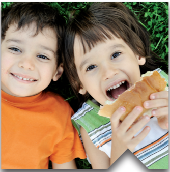
Groen is goed. Als we investeren in groene innovatie, landbouw, natuur en goede ideeën, dan blijven wij en onze kinderen gezond.