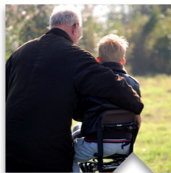
Samen maken we ons land sterk. Als we investeren in elkaar, komen we verder dan alleen. We stimuleren een toekomstbestendige economie en zorgen voor een goed pensioen.