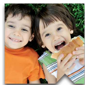
Groen is goed. Als we investeren in groene innovatie, landbouw, natuur en goede ideeën, dan blijven wij en onze kinderen gezond.