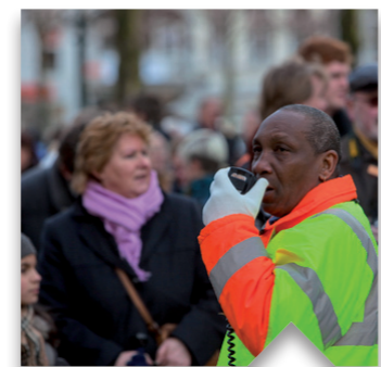
Iedereen doet mee. Als we investeren in werk voor mensen, kan iedereen bijdragen aan een sterk en gelukkig Nederland.

GroenLinks investeert in de toekomst. Goede investeringen verdienen zichzelf terug. Talloze plannen van GroenLinks bewijzen dat in de praktijk.