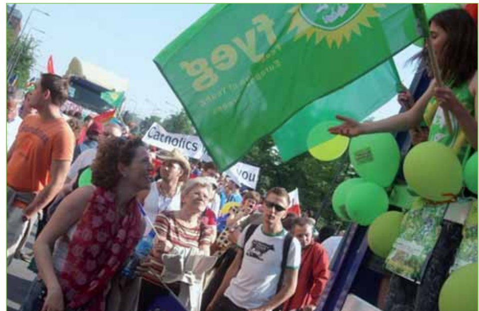
KATHALIJNE BUITENWEG TIJDENS POOLSE PROTESTMARS

GroenLinks wil een duurzame toekomst voor Europa met gelijke kansen voor iedereen. We hebben een optimistische kijk op de toekomst: met oog voor de lange termijn en in het belang van komende generaties. www.groenlinks.nl/programma